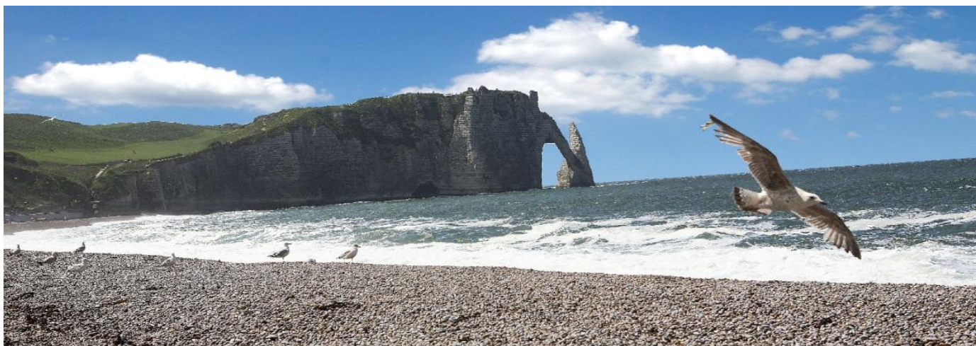
Klippene i Etretat Disse ligger nord for Le Havre og er ikke med i programmet (grunnet for lang kjøretid)

Byen Rouen er et ideelt utgangspunkt for alle mulige utflukter og har en rik historie. I tillegg er dette et område mange nordmenn ikke har reist til – noe som gjør at det blir en ny opplevelse for de fleste. Dere bor i en av de mindre byene langst kysten: Trouville-sur-Mer.